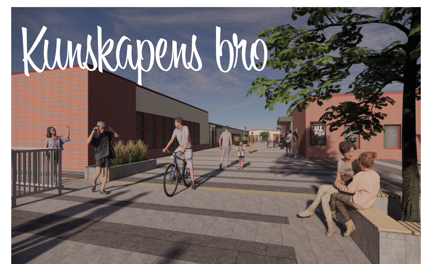
Vy vid kunskapens bro mellan Porsö centrum och LTU. På bilden nedan se den nya soltrappan som byggs i hörnet vid Ica. Illustration: aochdarkitekter

För att underlägga orienteringen i det täta Porsö centrum behövs tydlig skyltning. I samband med ombyggnaden av skärmtaken monterar nya, enhetliga skyltar för verksamheterna. Orienteringstavlor monterar vid alla entréer till centrumet.